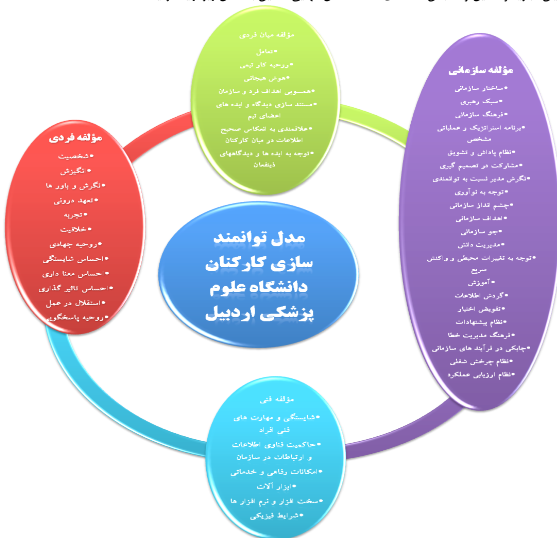
شکل ۴- مدل نهایی تحقیق

بعد از پایان تجزیه و تحلیل و سنجش داده های مختلف، مدل نهایی تحقیق به شکل زیر ارائه گردیده است.