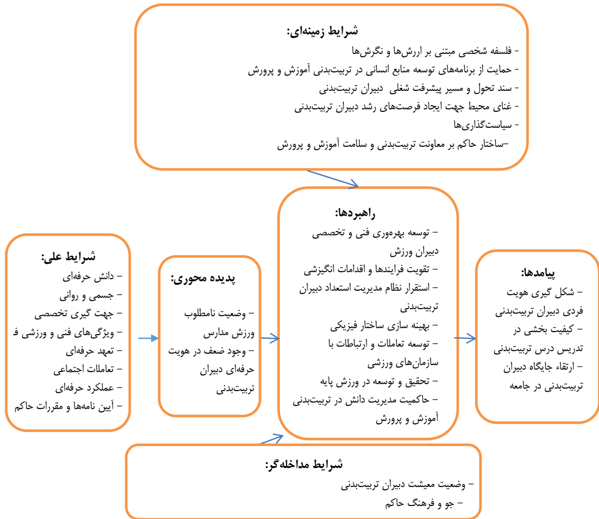
شکل ۱- مدل پارادایمی تکامل هویت حرفه‌ای دبیران تربیت بدنی

در این مرحله برقراری رابطه بین طبقه‌های تولید شده (در مرحله کدگذاری‌ها) است. این کار براساس مدل پارادایم انجام می‌شود و به نظریه پرداز کمک می‌کند تا فرآیند نظریه را به سهولت انجام دهد. نمودار مربوطه به شرح نمودار ۱ ذکر شده است.